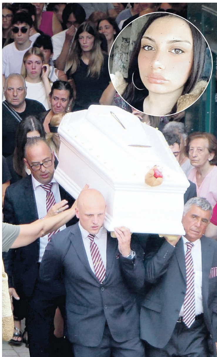
La bara viene portata a spalla fuori dalla chiesa